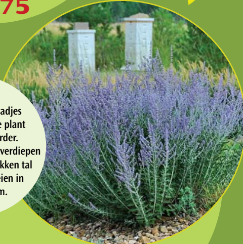
Perovskia atriplicifolia Russische salie c3

Met zijn grijzig-groene blaadjes is dit een prachtige plant voor de grijze border. De blauwe bloempjes verdiepen het kleureffect en lokken tal van vlinders. Snoeien in maart op 30cm.