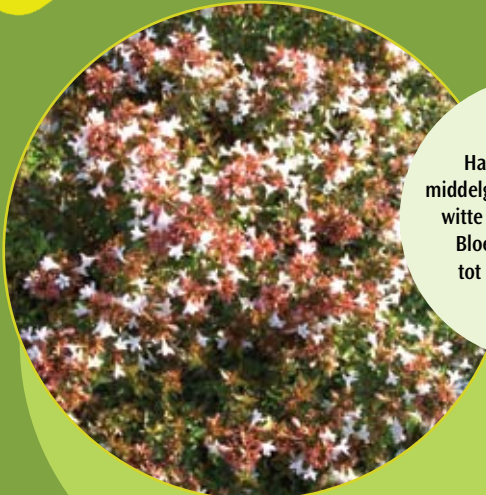
Abelia grandiflora c3

Halfbladhoudende middelgrote struik met fijne witte of roze bloempjes. Bloeit de hele zomer tot laat in de herfst.