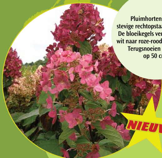
Hydrangea 'Mega Mindy'® Pluimhortensia c3

Pluimhortensia met stevige rechtopstaande takken. De bloeikegels verkleuren van wit naar roze-rood in de herfst. Terugsnoeien in maart op 50 cm.