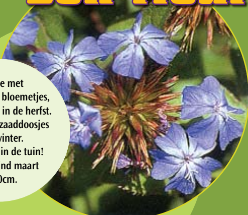
Ceratostigma willmottianum Loodkruid c3

Struikje met azuurblauwe bloemetjes, bloeit tot laat in de herfst. Decoratieve zaaddoosjes in de winter. Een juweel in de tuin! Snoeien eind maart op 10cm.