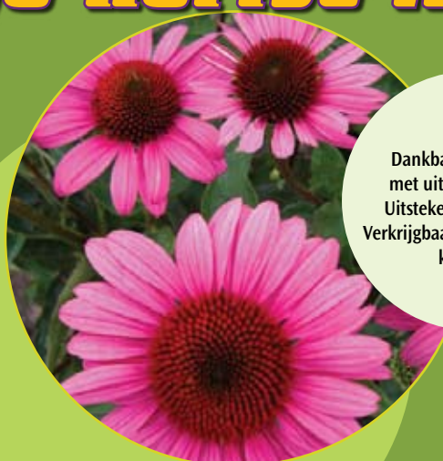
Echinacea in cultivars Zonnehoed c1,5

Dankbare vaste plant met uitbundige bloei. Uitstekende snijbloem. Verkrijgbaar in verschillende kleuren.