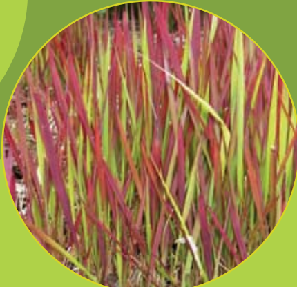
Imperata 'Red Baron' Japans bloedgras c1,5