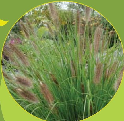
Pennisetum 'Hameln' Lampenpoetsersgras P9