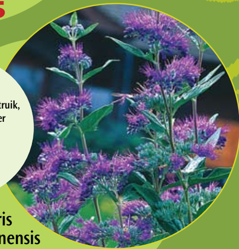
Caryopteris clandonensis Blauwe spirea c3

Lage bladverliezende struik, bloeit in de nazomer tot eind oktober. Snoeien in maart op 30cm. Vlinderlokker.