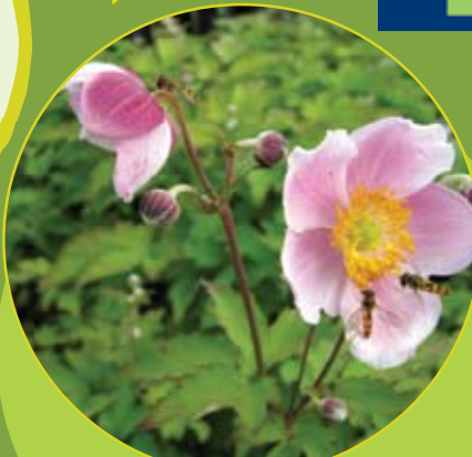
Anemone japonica wit of roze Herfstanemoon c1,5